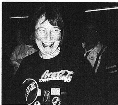
Séquences émotions : il rit, elle pleure de Joie