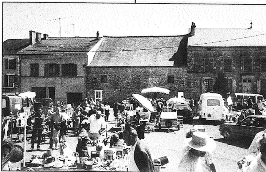
Approchez, approchez, il y a encore de la place

NOUS SOMMES CHAMPIONS DU MONDE DE FOOTBALL